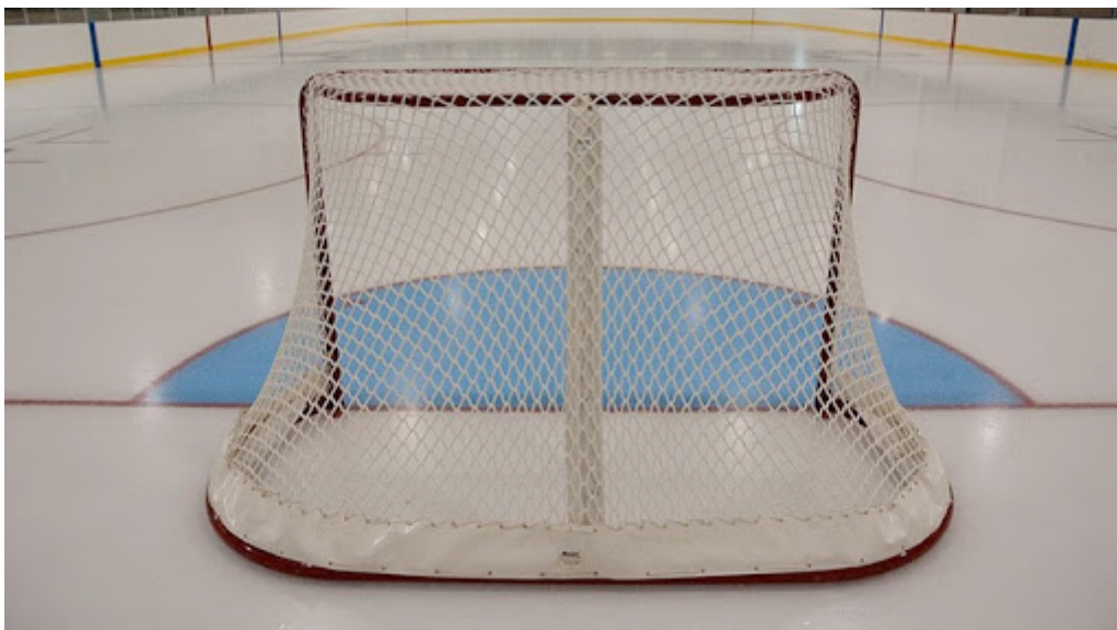
Схема розташування камер над воротами та за воротами